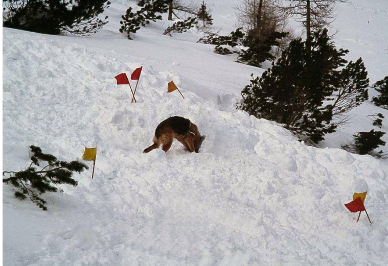
Zasuti je brez ustrezne opreme, brez lavinske žolne, obsojen na čakanje organizirane pomoči