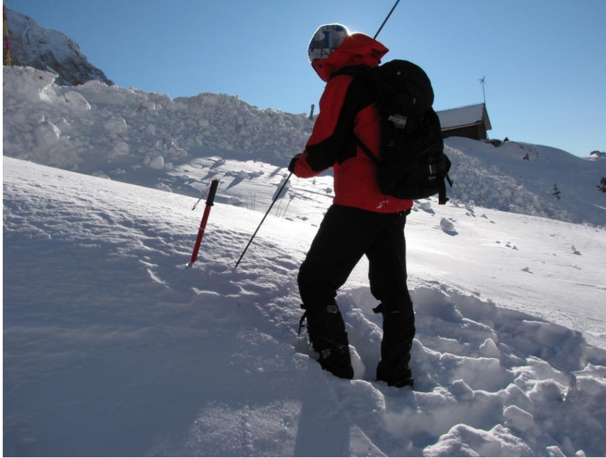
Na mestu najboljšega signala zasadite lopato in takoj pričnite s pravokotnim spiralnim sondiranjem

O situaciji, ko je zasutih hkrati več oseb: https://www.volontar.net/clanek.php?pid=23